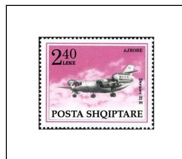
Avion « Dornier 31E »