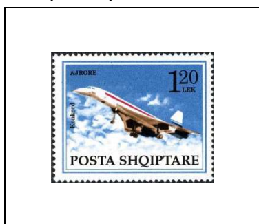
Supersonique « Concorde »