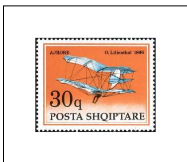
Planeur d'Otto Lilienthal, 1896