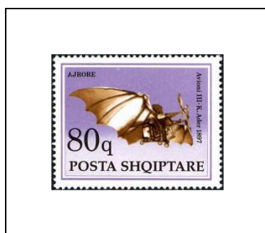
« Avion III » de Clément Ader, 1897