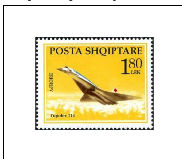
Supersonique « Tupolev 144 »