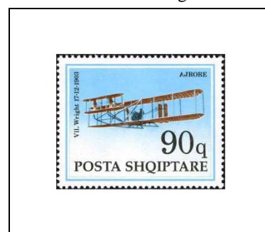
Avion à moteur des frères W. et O. Wright