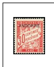
30 c 3