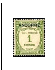
1 c 9