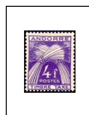
4 f 36