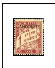
1 f 6