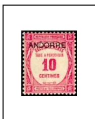
10 c 10