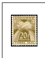
20 f 39