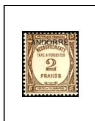
2 f 14