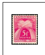
5 f 29