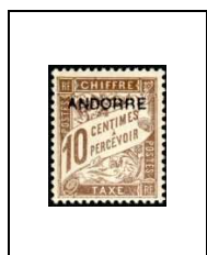
10 c 2