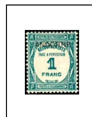
1 f 12