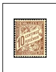
10 c 18