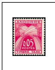
5 c 42