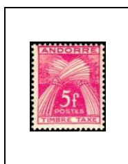
5 f 37