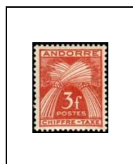
3 f 27