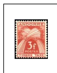
3 f 35