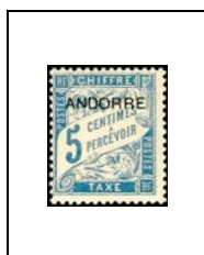
5 c 1