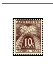
10 c 32