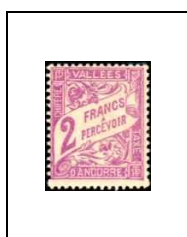
2 f 19