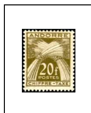
20 f 31