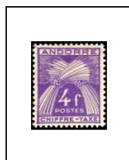
4 f 28