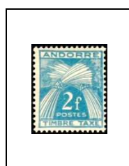
2 f 34