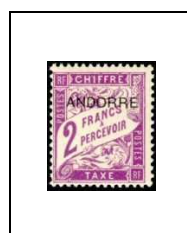
2 f 7