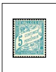
5 c 17