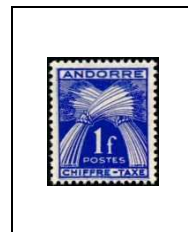
1 f 24