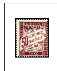
50 c 4