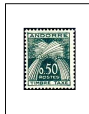
50 c 45