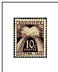
10 c 21