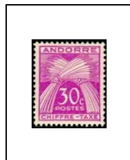
30 c 22