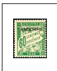
60 c 5