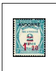
1 F 20 sur 2 f 13