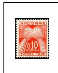
10 c 43