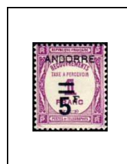
5 F sur 1 f 15