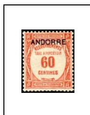
60 c 11