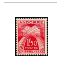
1 f 50 25