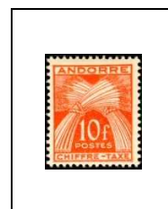
10 f 30