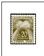
20 c 44