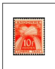
10 f 38