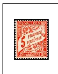
5 f 20