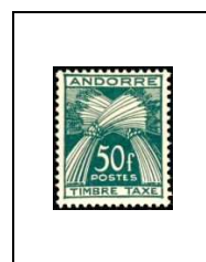
50 f 40