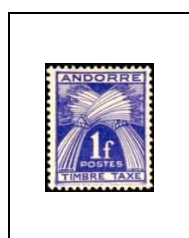
1 f 33