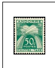
50 c 23