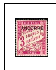
3 f 8