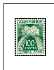
100 f 41