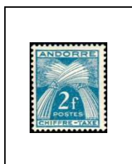
2 f 26