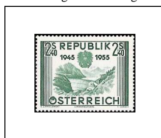
Barrage de Limberg