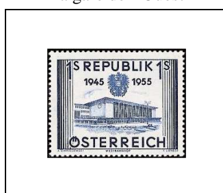
La gare de l'Ouest