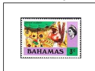
Marché de la paille