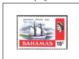
Bateau pour la pêche des éponges