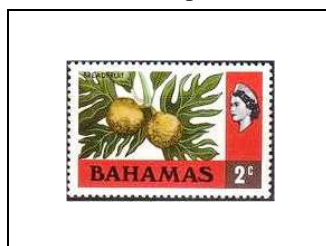
Fruit à pain