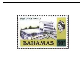
Hôtel des postes, à Nassau