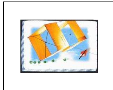
« Gibson Girl »