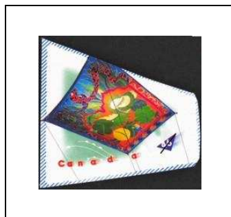
« Tapis volant Jardin Indien »