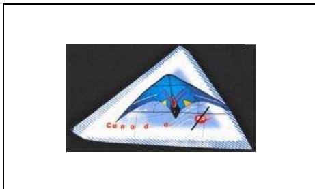
« Master Control »