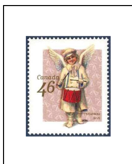
Jouant du tambour