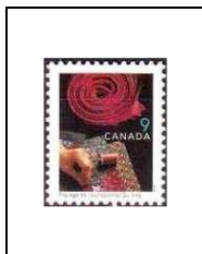
Piquage de courtpointe