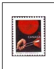
Soufflage du verre