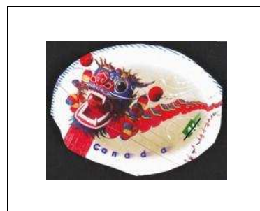
En forme de dragon