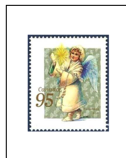
Regardant l'étoile de Noël