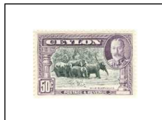
La baie des éléphants