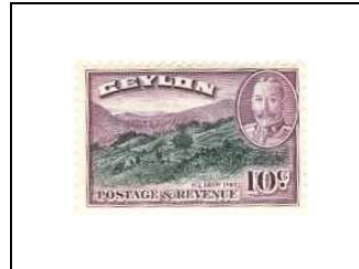
Cultures du riz de montagne