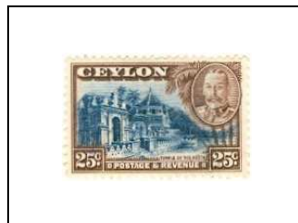
Temple de la dent (Kandy)