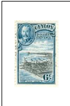
Port de Colombo