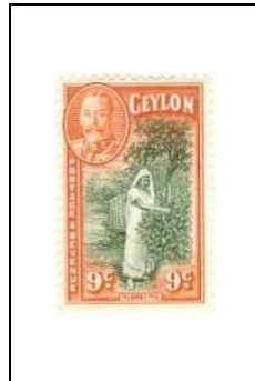
Récolte du thé