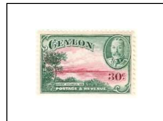
Ancien canal d'irrigation