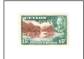
Rivière de Ceylan