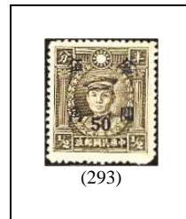
50 (c) s 1/2 c 665