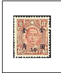
10 (c) s 40 c 654