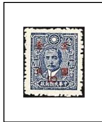
10 (c) s 20 $ 659