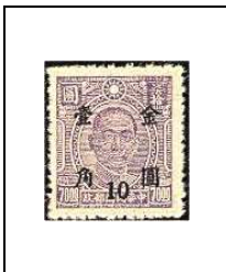
10 (c) s 70 $ 662