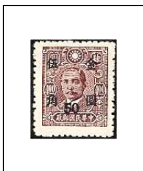
50 (c) s 4 $ 671