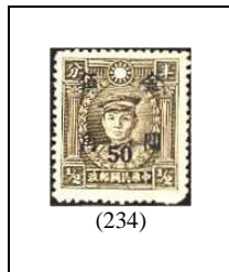
50 (c) s 1/2 c 664