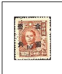
10 (c) s 7000 $ 663