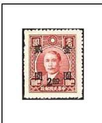
2 $ s 100 $ 682