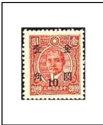
10 (c) s 20 $ 657