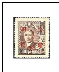
8 $ s 30000 $ 687