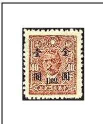
1 $ s 40 c 677