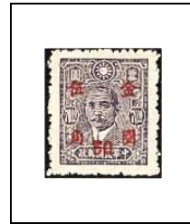
50 (c) s 70 $ 675