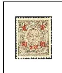
2 $ s 2 $ 680