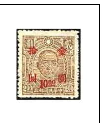
10 $ s 2 $ 689a