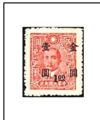
1 $ s 5 $ 679