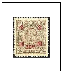
20 $ s 2 $ 690