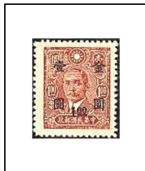
1 $ s 1 $ 678