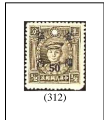
50 (c) s 1/2 c 666