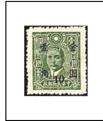
10 (c) s 1 $ 655