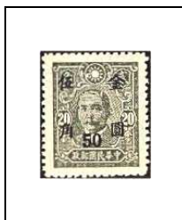
50 (c) s 20 c 667