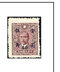
50 (c) s 4 $ 671a