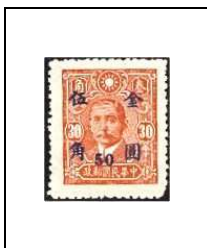
50 (c) s 30 c 668