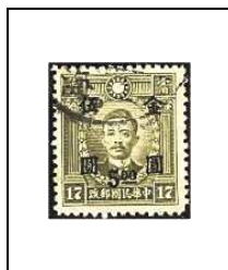
5 $ s 17 c 683