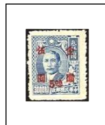
5 $ s 3000 $ 685