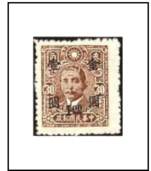
1 $ s 30 c 676