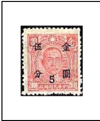
5 (c) s 20 $ 652