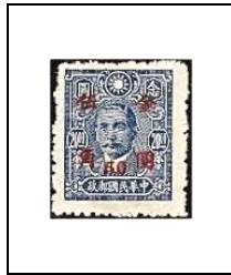
50 (c) s 20 $ 673