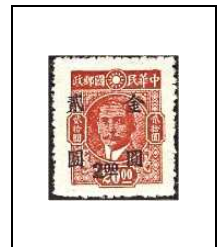
2 $ s 20 $ 681