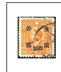
10 $ s 40 c 688