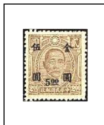
5 $ s 2 $ 684