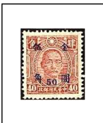
50 (c) s 40 c 670