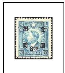
8 $ s 20 c 686