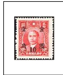
10 (c) s 20 $ 660