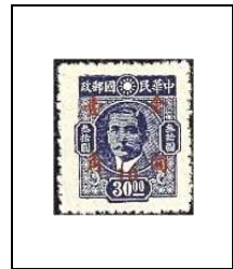
10 (c) s 30 $ 661