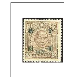
10 $ s 2 $ 689