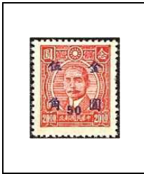
50 (c) s 20 $ 672