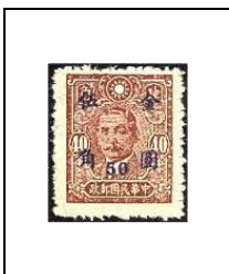
50 (c) s 40 c 669