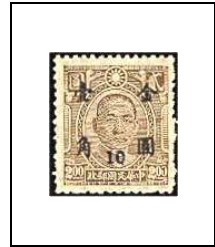
10 (c) s 2 $ 656