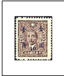
10 (c) s 25 c 653