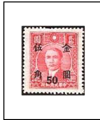
50 (c) s 20 $ 674