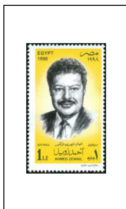
Gagnant de la récompense de l'Institut Franklin