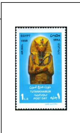
Sarcophage du Pharaon Toutankhamon