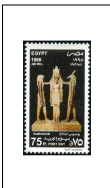
Statuette représentant le couronnement du Pharaon Ramsès III