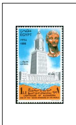
Le Phare d'Alexandrie, une des sept merveilles du monde