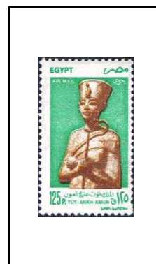
Le Pharaon Toutankhamon