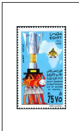
Egypte, vainqueur de la 21 e Coupe d'Afrique des Nations