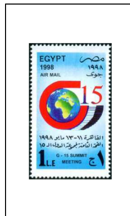
8 e Sommet du G-15