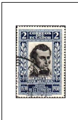
J.-A. de Sucre