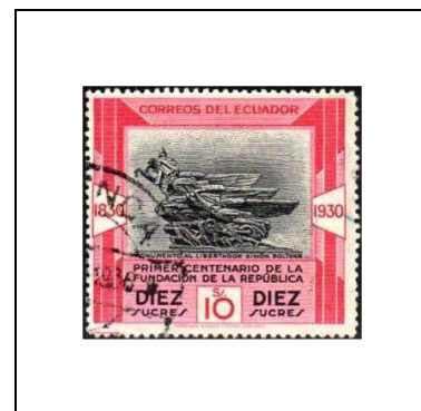
Monument à Bolivar