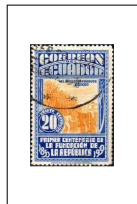
Plantation de cannes à sucre