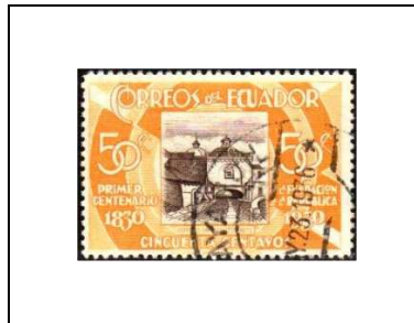
Monastère de Saint-Domingo et arche coloniale, à Quito