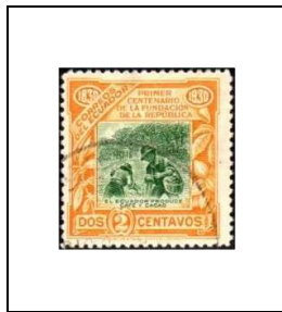
Plantation de cacaoyers