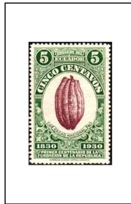
Fruit de cacaoyer