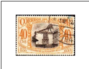
Vue de Quito