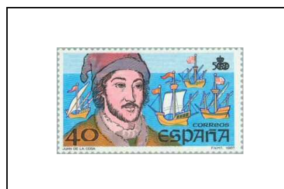
Juan de la Cosa