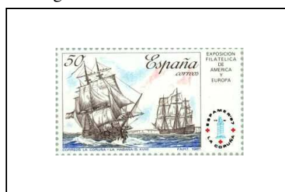
Voiliers assurant la Poste entre La Corogne et La Havane au 18 e siècle