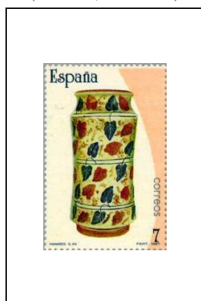
Vase décoré de feuilles (Valence, 15 e siècle)