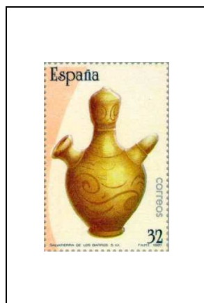
Gargoulette (Estrémadure, 20 e siècle)