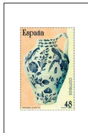
Pichet (Andalousie, 18 e -19 e siècle)