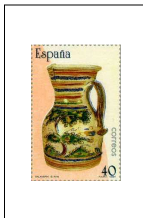
Pichet (Tolède, 18 e -19 e siècle)