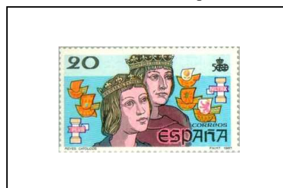
Les Rois catholiques