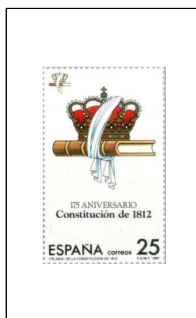
Emblème de l'anniversaire