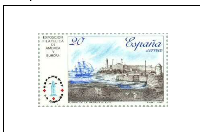
Le port de La Havane au 18 e siècle