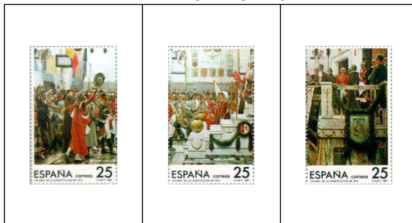
Tableau de Salvador Viniegra « La promulgation de 1812 »