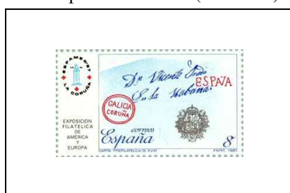
Lettre pour La Havane (18 e siècle)

Exposition philatélique mondiale, à La Corogne, du 2 au 12.10.87