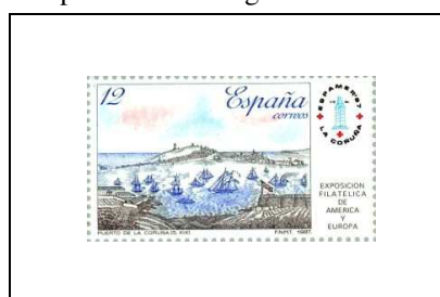
Le port de La Corogne au 19 e siècle