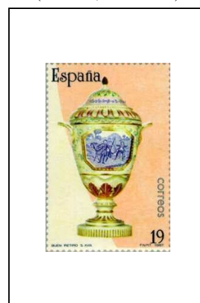
Vase à deux anses et couvercle (Madrid, 17 e siècle)