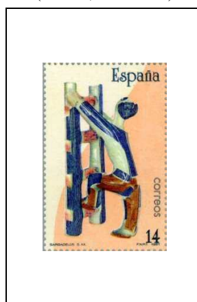
Homme grimant à une échelle (Galice, 20 e siècle)