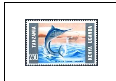
Pêche de haute mer (Tanzanie)