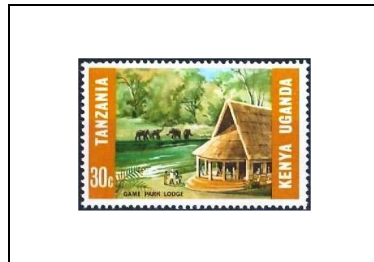
Game park Lodge (Tanzanie)