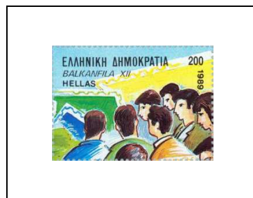
Philatélistes devant un panneau d'exposition