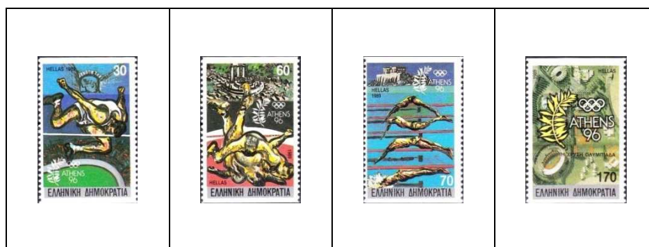
30 d 1699/B 60 d 1700/B 70 d 1701/B 170 d 1702/B