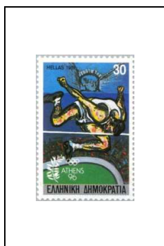
30 d 1699/A