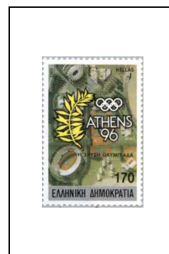
170 d 1702/A