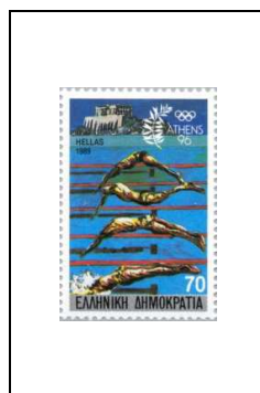
70 d 1701/A