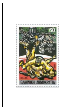
60 d 1700/A