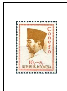
10 r + 5 r 418