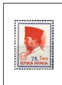
75 s s. 75 r 451