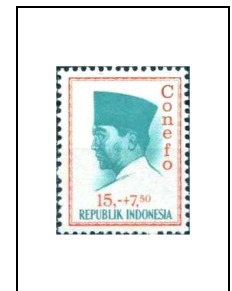
15 r + 7 r 50 420