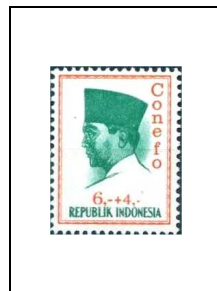
6 r + 4 r 417