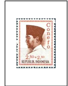
2 r 50 + 2 r 50 415