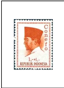
1 r + 1 r 411