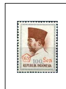
100 s s. 100 r 452