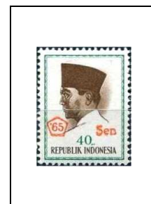
40 s s. 40 r 449