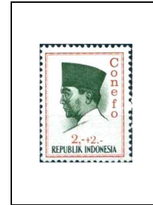
2 r + 2 r 414