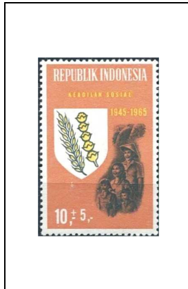
Agriculture et famille