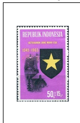
Etoile et mosquée