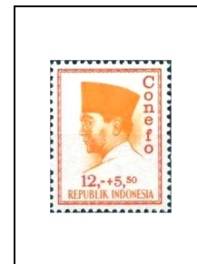
12 r + 5 r 50 419