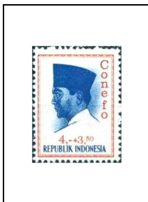
4 r + 3 r 50 416