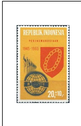
Emblème de Bandoeng