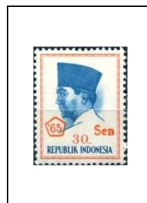
30 s s. 30 r 448