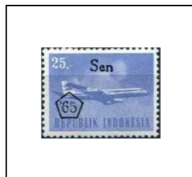
25 s s. 25 r 447