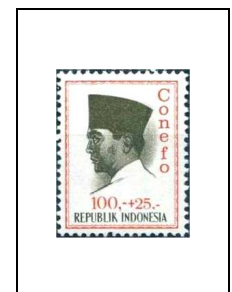
100 r + 25 r 424