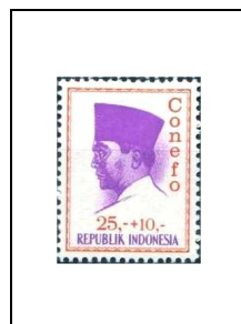
25 r + 10 r 422