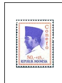
50 r + 15 r 423