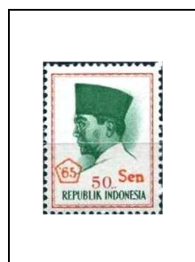
50 s s. 50 r 450