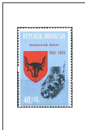
Tête de bovin et conférence