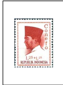
1 r 25 + 1 r 25 412