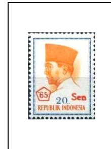
20 s s. 20 r 446