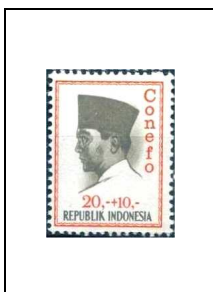
20 r + 10 r 421