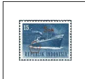
15 s s. 15 r 445