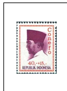
40 r + 15 r 422A