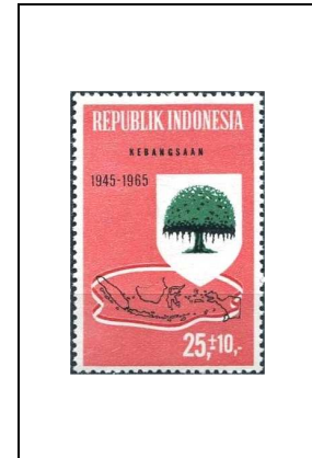
Arbre et carte