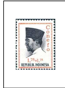
1 r 75 + 1 r 75 413