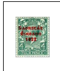
4 p 31