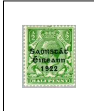
½ p 25