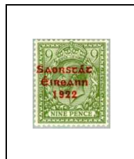
9 p 34