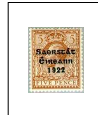
5 p 32