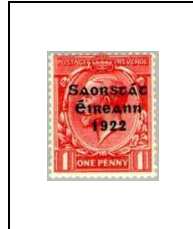
1 p 26