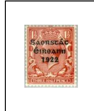
1½ p 27