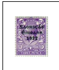
3 p 30