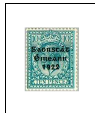
10 p 35