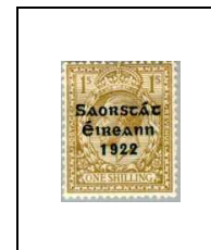
1 s 36