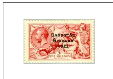
5 s 38