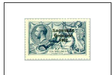
10 s 39