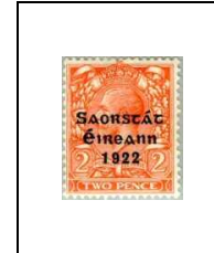
2 p 28