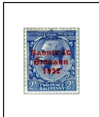
2½ p 29