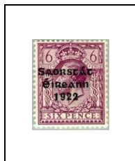
6 p 33