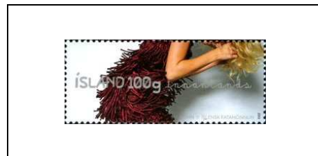
Robe de Steinunn Sigurdardóttir