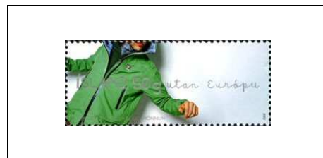
Vêtement de 66° NORTH