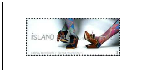
Chaussures et bas conçus par Hugnn Dögg Amadóttir et Magni Þorsteinsson