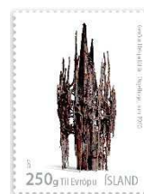
« Orgelfuga » (1960) de Gerour Helgadóttir