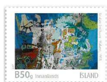
« Malverk » (1958) de Kristjan Daviosson