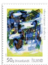
« An nafns » (1970) de Hafsteinn Austmann