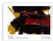
« Komposition » (1965) de Eiríkur Smith