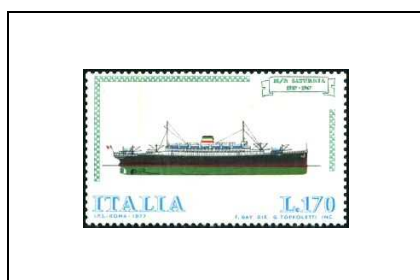
Bateau à moteur