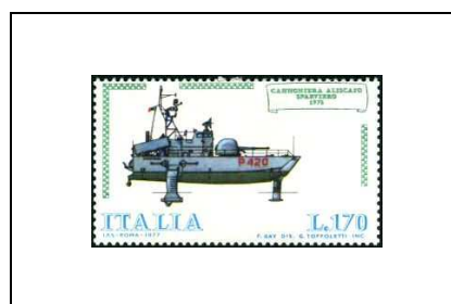
Canonnière à voiles