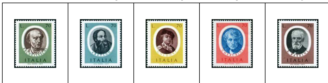
Eduardo Bassini (1846-1924), chirurgien