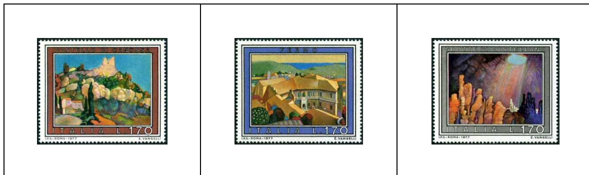
Grottes de Castellana, Les Pouilles