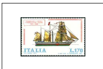
Navire à aubes