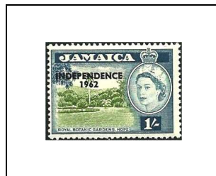
1 s 221