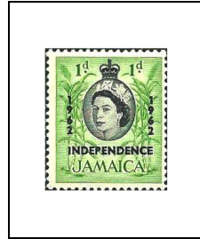
1 p 216