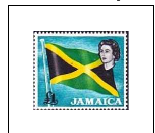
Elizabeth II et drapeau