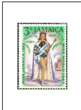
3 p 212