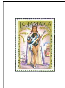
1 s 213