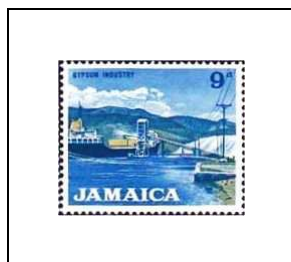
Industrie du gypse