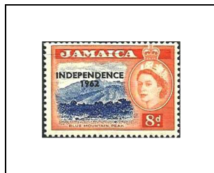
8 p 220