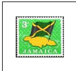
Carte et drapeau