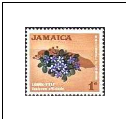
Lignum vitae, fleur nationale