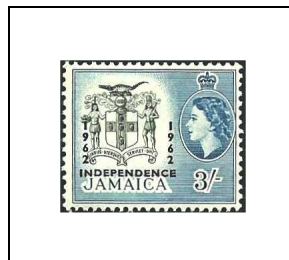
3 s 223