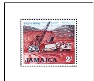
Mine de bauxite