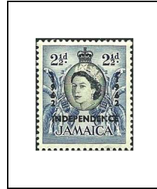
2 1/2 p 217