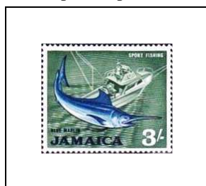
Marlin bleu et pêche sportive