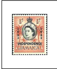
1/2 p 215