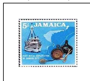
Exploration de Sunken City, à Port-Royal