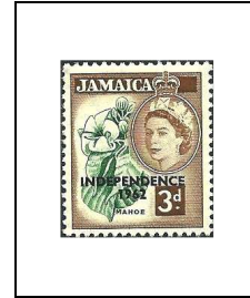
3 p 218