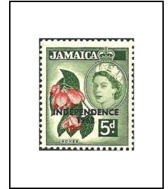
5 p 219