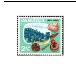
Coquillages terrestres et paysage