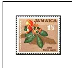
Ackee, fruit national