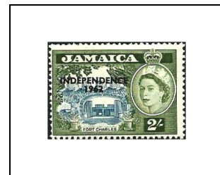
2 s 222