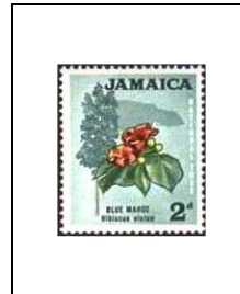
Hibiscus mahoe bleu, arbuste national