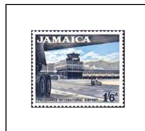
Aéroport international Palisadoes