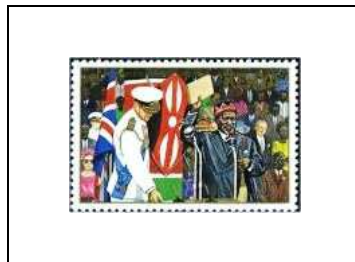
Cérémonie de l'Indépendance, 1963