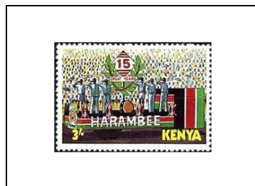
Fête du 15 e anniversaire « Harambee »