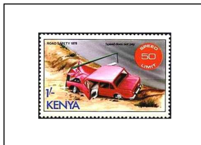
Dangers de la vitesse