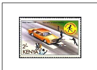
Ralentir à la sortie des écoles