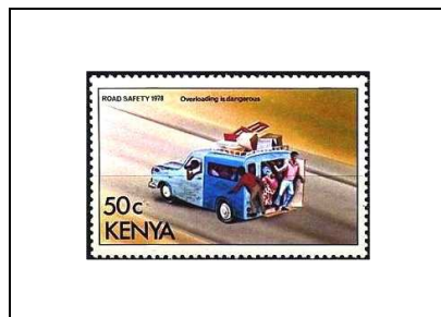
Dangers de la surcharge