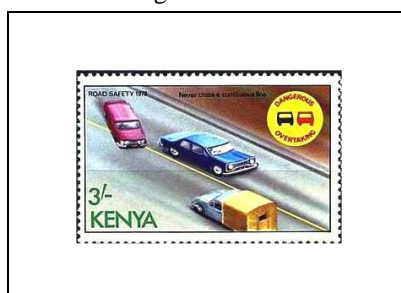
Danger de doubler