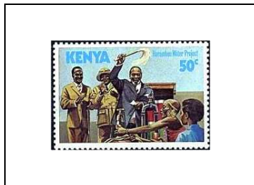
Projet de régularisation des eaux « Haramber »