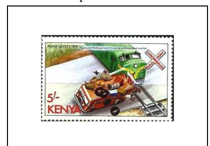
Approche des passages à niveau avec précaution