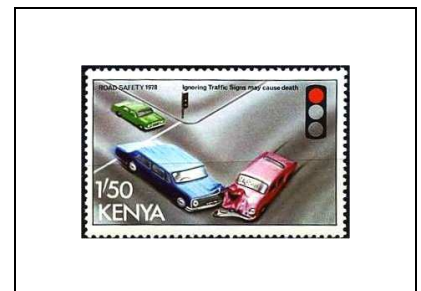
Respects des signalisations routières