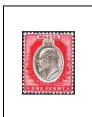
1 p 19