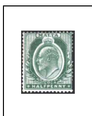
½ p 18