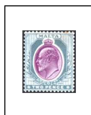
2 p 20