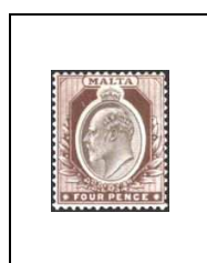
4 p 23