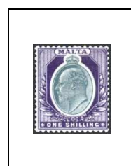
1 s 24