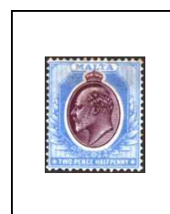
2½ p 21