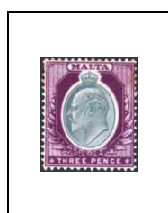
3 p 22