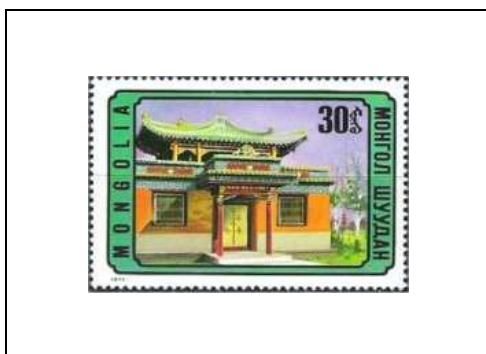
Détail du temple « Miséricorde », à Oulan-Bator