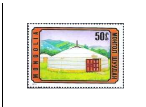
Une yourte mongole