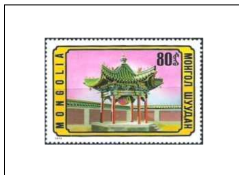
Tonnelle dans l'enceinte d'un cloître