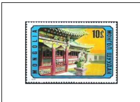
Détail du temple bouddhique dans le palais du Bogdo-Gegen