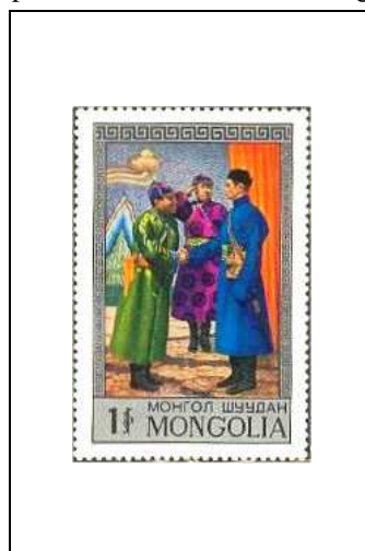
« Edre », pièce de théâtre de D. Namdag