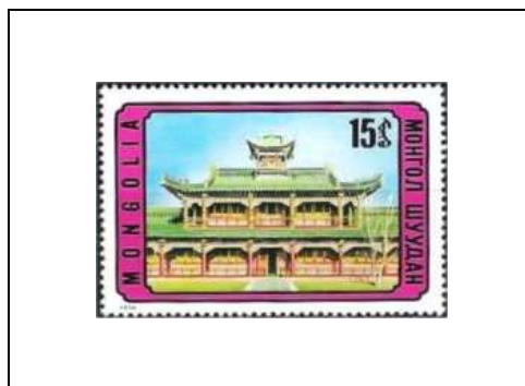
Ancien temple bouddhique, aujourd'hui musée bouddhique