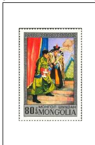
« Edre », pièce de théâtre de D. Namdag