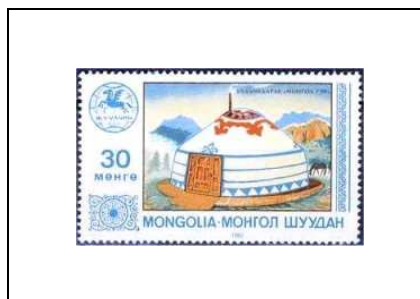
Tente en peau « Yurt »