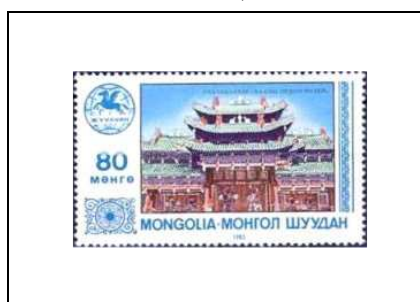
Musée des Khans, Oulan-Bator