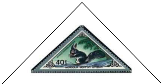
Sciurus vulgaris linnaeus