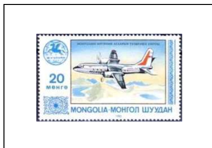
Avion Antonov AN-2413 de la Compagnie mongole