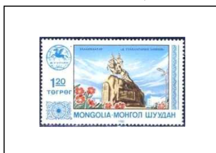
Monument Soukhe Bator, Oulan-Bator