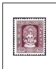
statue de Vichnou