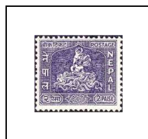
Krishma vainqueur du serpent