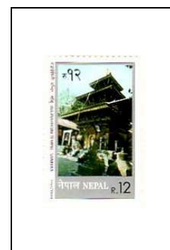
Le Temple Bajrayogini, à Sankhu