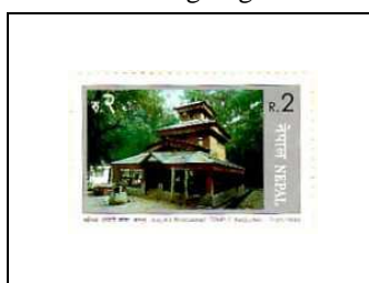
Le Temple Kalika Bhagawati, à Baglung