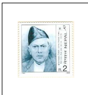
Gopalprasad Rimal (1917-1973)