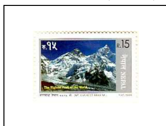
Le Mont Everest (8848 m.)