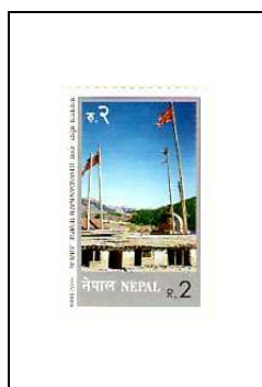
Le Temple Chandan Nath, à Jumla