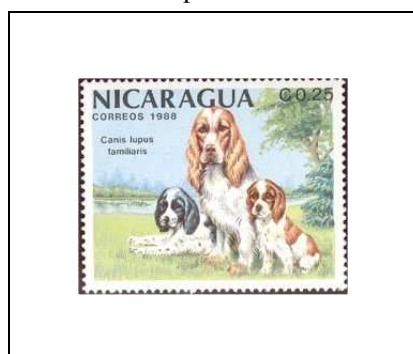
Canis lupus familiaris