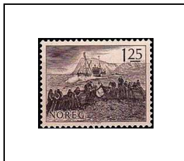
Pêche aux harengs