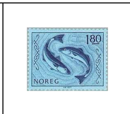
Morues et hameçons