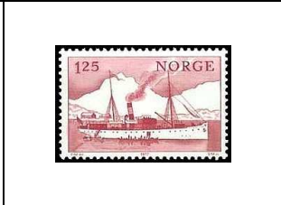
Le vapeur « Vesteraalen »