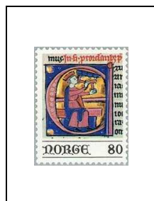
« David avec les clochettes »