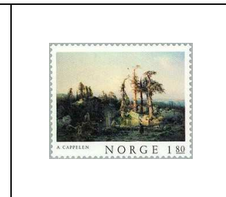
« Etang forestier dans le bas Telemark », par A. Cappelen