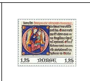
La Vierge avec l'Enfant