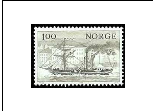
Le « Constitutionen »