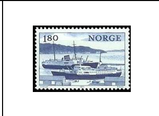
« Nordstjernen » et le « Harald Jarl »