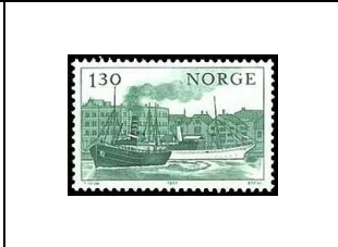
Le « Kong Haakon » et le « Dronningen »