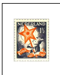
1½ (1½) c 259