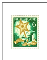
6 (+ 4) c 261