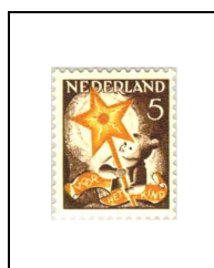
5 (+ 3) c 260