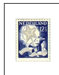
12½ (+ 3½) c 262

Dentelure incomplète aux extrémités des petits côtés