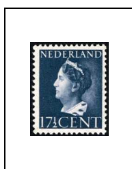
17½ c 439