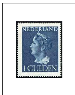
1 g 442