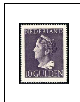
10 g 445