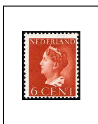
6 c 438A