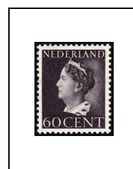
60 c 441