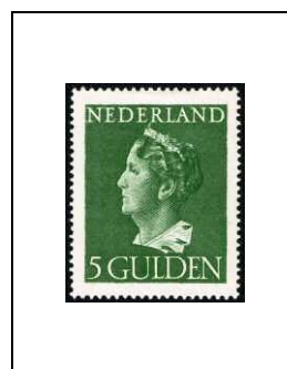
5 g 444