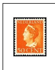
50 c 440