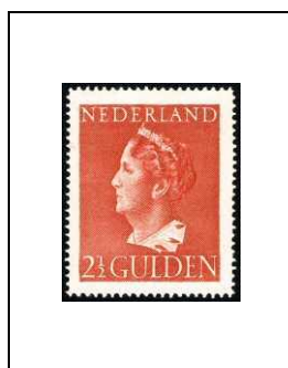
2½ g 443