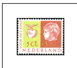
5 c + 3 c 614