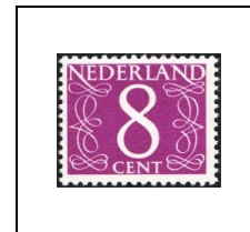
8 c 612A