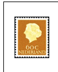
60 c 608a