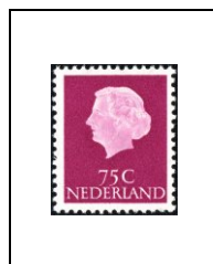
75 c 609a