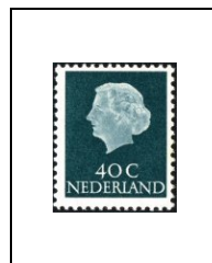
40 c 605