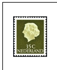
35 c 604A