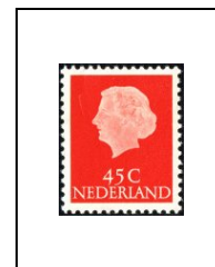
45 c 606