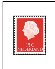
15 c 601