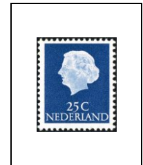
25 c 603