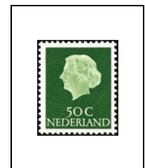
50 c 607