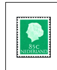
85 c 610