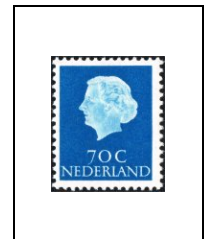
70 c 608Aa