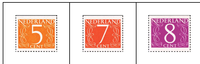
5 c 611a 7 c 612a 8 c 612Aa