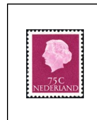
75 c 609