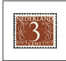
3 c 610