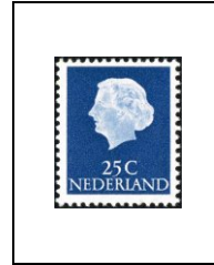
25 c 603a