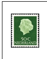
50 c 607a