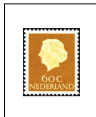
60 c 608