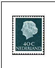
40 c 605a