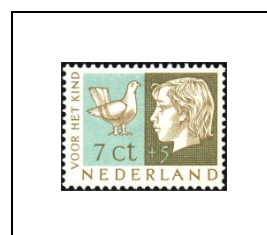
7 c + 5 c 615