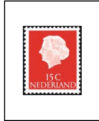
15 c 601a