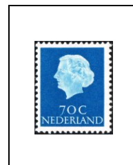
70 c 608A