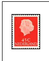
45 c 606a