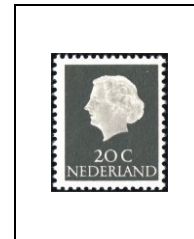
20 c 602