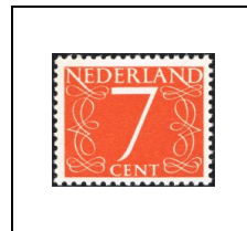
7 c 612