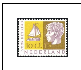
10 c + 5 c 616