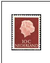
10 c 600