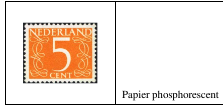
5 c 611 5 c 611a