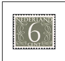
6 c 611A