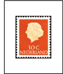
30 c 604a