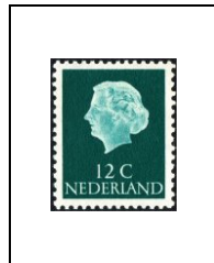
12 c 600A