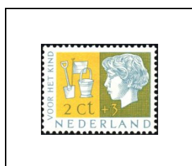
2 c + 3 c 613