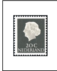
20 c 602a