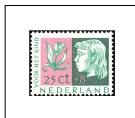
25 c + 8 c 617