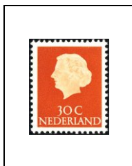
30 c 604