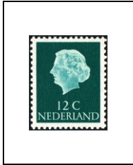
12 c 600Aa