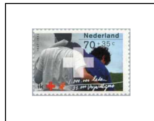
70 c + 35 c 1411