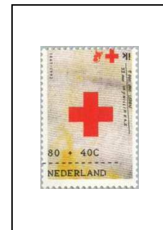
80 c + 40 c 1412