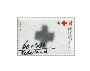
60 c + 30 c 1410