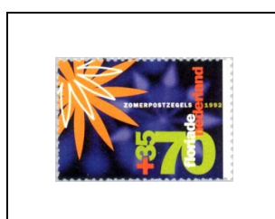
70 c + 35 c 1401