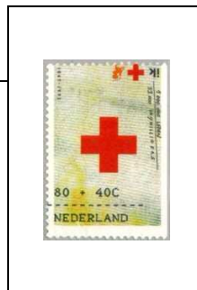
1411a 80 c + 40 c 1412a