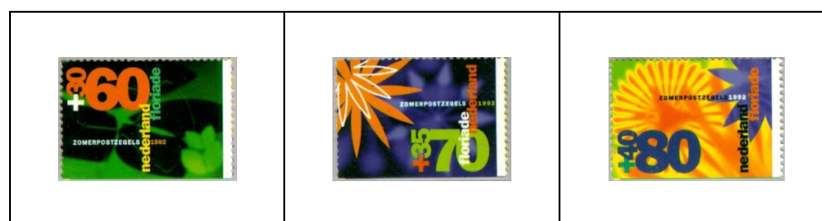
60 c + 30 c 1400a 70 c + 35 c 1401a 80 c + 40 c 1402a