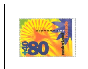
80 c + 40 c 1402