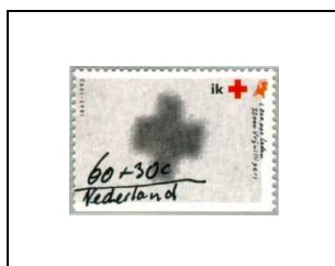
60 c + 30 c