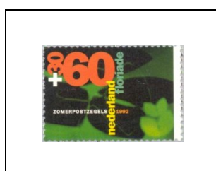
60 c + 30 c 1400