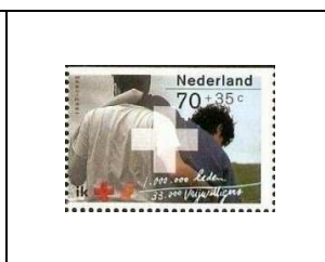
1410a 70 c + 35 c