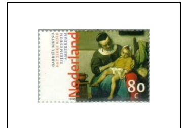
« L'Enfant malade », de Gabriel Metsu