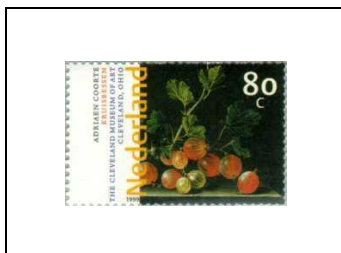
« Groseilles », d'Adriaen Coorte