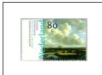
« Vue de Haarlem », de Jacob Van Ruisdael