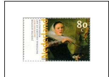
« Autoportrait », de Judith Leyster