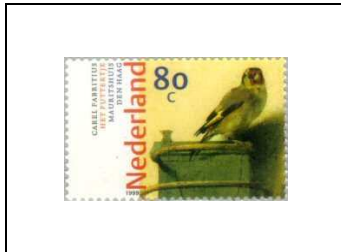
« Le Chardonneret », de Carel Fabritus