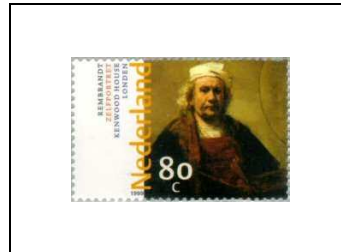
« Autoportrait », de Rembrandt