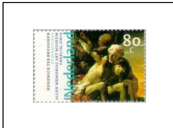
« Saint Sébastien », de Hendrick Ter Brugghen