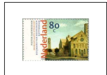
« La Mariaplaats à Utrecht », de Pieter Saenredam