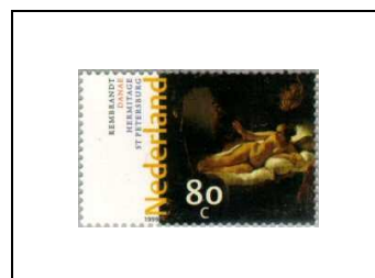
« Danaé », de Rembrandt