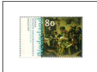
« In weelde siet doe », de Jan Steen