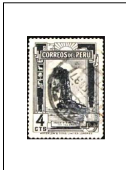
Puits de pétrole