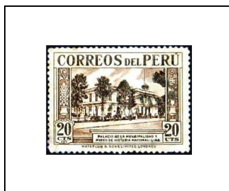
Hôtel de Ville et Musée de Lima