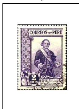
Don Manuel de Amat y Junyent