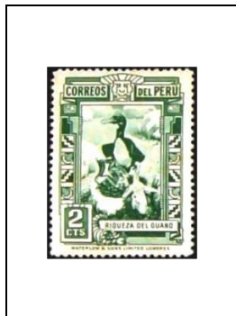
Le guano, richesse nationale