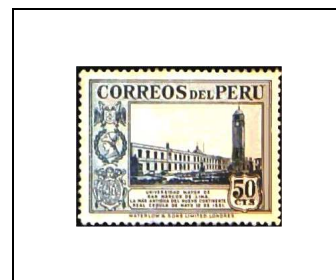
Université San Marcos, à Lima