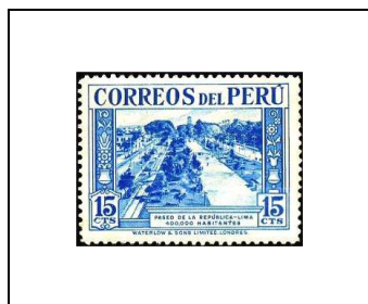
Promenade de la République, à Lima