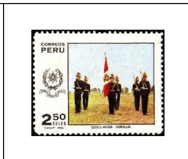
Ecole de l'armée de Terre