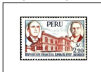
Présidents Dr Manuel Prado et René Coty et palais de l'exposition