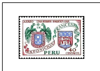
Armes de Lima et de Bordeaux