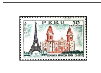
Tour Eiffel et cathédrale de Lima