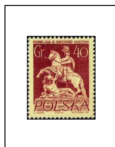
Statue du roi Jan III Sobieski