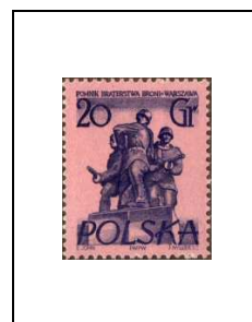
La fraternité d'armes