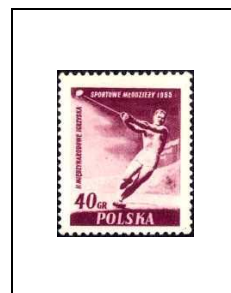
Lancement du marteau