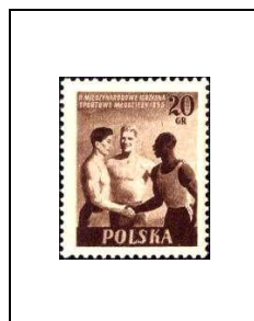
Sportifs de trois races