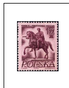
Statue du prince Josef Poniatowski