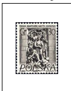
Monument aux défenseurs du ghetto