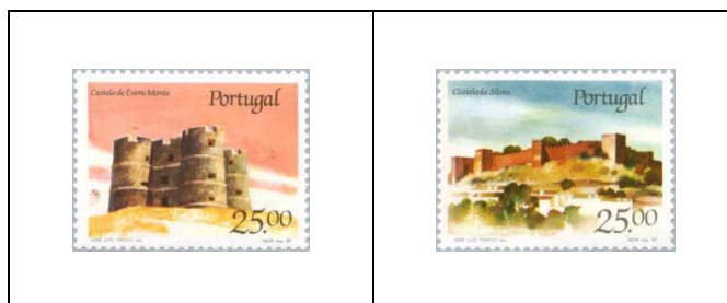
Château de Silves