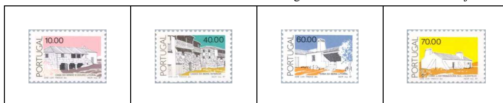
Estrémadure-Sud et Alentejo