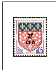
Armoiries de villes Amiens