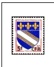
Armoiries de villes Troyes