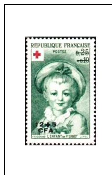
L'enfant en Pierrot