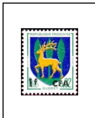
Armoiries de villes Guéret