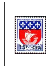
Armoiries de villes Paris