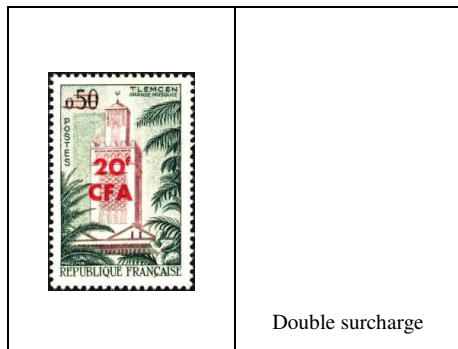
Mosquée de Tlemcen, en Algérie