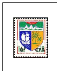
Armoiries de villes Saint-Denis de la Réunion