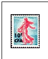
Semeuse de Piel