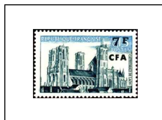
Cathédrale de Laon