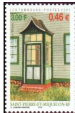
Mairie de l'île-aux-Marins