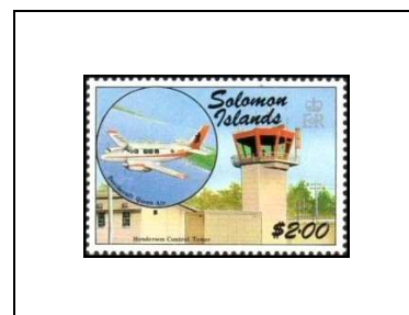
Avion « Beechcraft Queen Air » et tour de contrôle d'Henderson