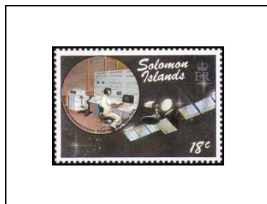
Satellite et opérateur à son pupitre