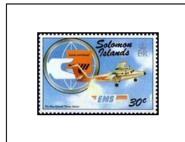
Mappemonde stylisée, lettre et et De Havilland « Twin Otter »