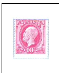
10 ö 28