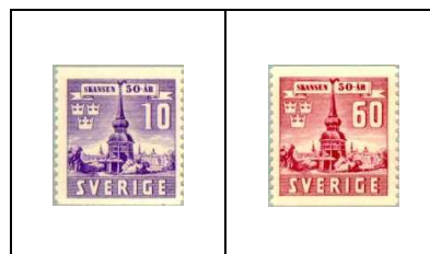
Copie du clocher de Hasjö et vue de Stockholm