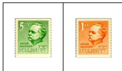
Arthur Hazelius, fondateur du Musée