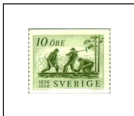
Poseurs de rails