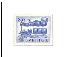
Train de 1856