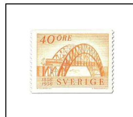
Train électrique franchissant le pont de Arsta, à Stockholm