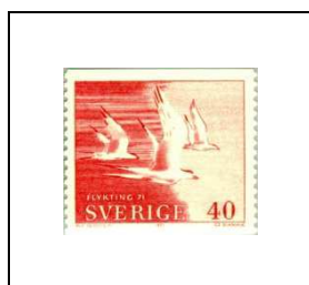
40 ö 685