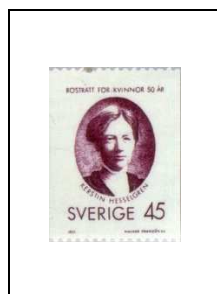
45 ö 683