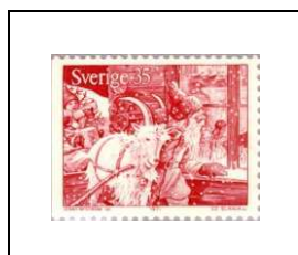
Le Père Noël