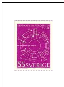
55 ö 693