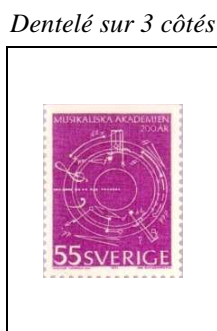
55 ö 693a