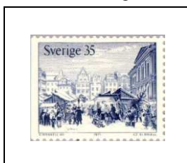
Le marché de Noël sur le Stortorget