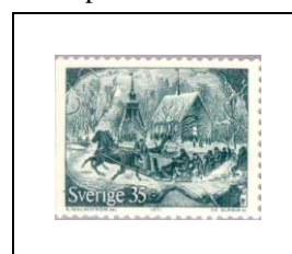
L'arrivée en traîneau pour le culte