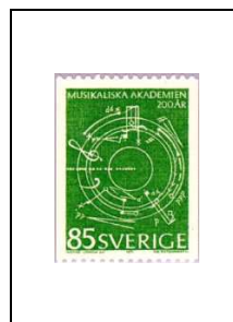
85 ö 694