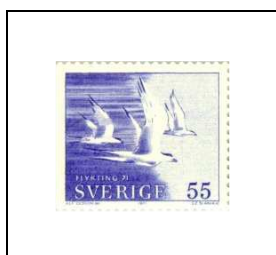
55 ö 686a