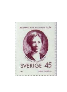
45 ö 683a