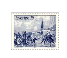
Patineurs sur le lac Malar