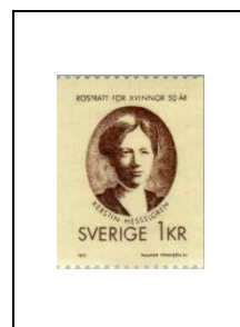
1 k 684