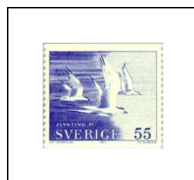
55 ö 686