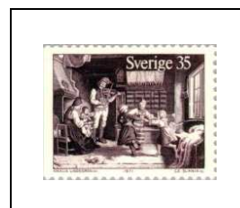
La veillée en famille