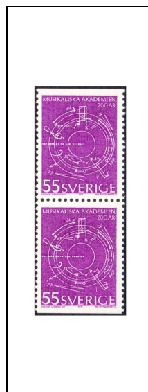
55 ö 693b