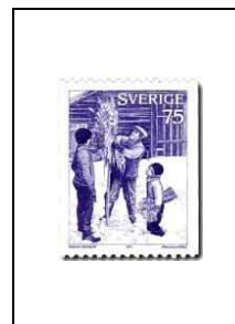
Gerbes de céréales pour les petits oiseaux