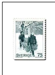
Le sapin de Noël