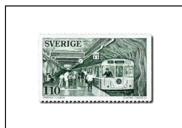
Rame de métro