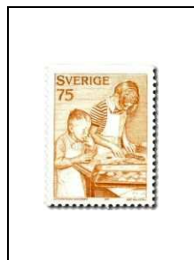
Les biscuits au gingembre