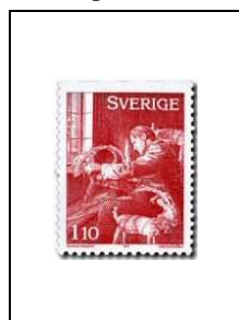
Bouc de Noël paille