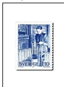
Confection de bougies de Noël