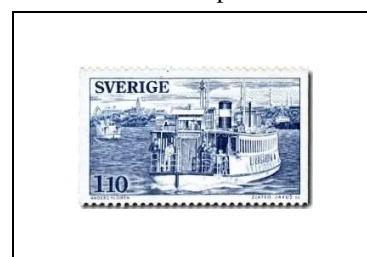
Bac à vapeur