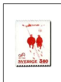
3 k 80 963