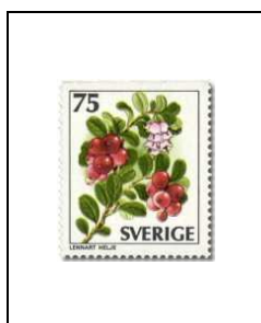
Vaccinium vitis idaea