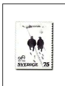
75 ö 962

Centenaire de la naissance du caricaturiste suédois Oskar Andersson (1877-1906)