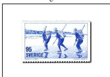
Patinage de fond