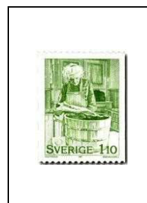
Préparation de la morue salée