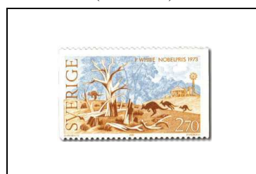
Patrick White (Australie)