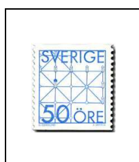
Jeu du renard