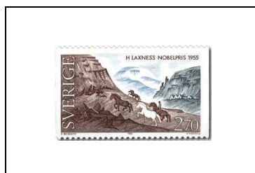
Halldor K. Laxness (Islande)