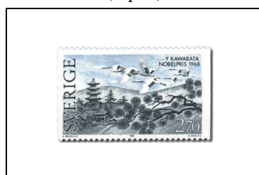
Yasunari Kawabata (Japon)