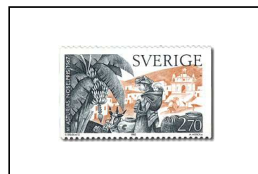
Miguel A. Asturias (Guatemala)