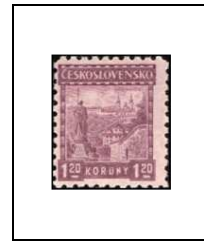
Monastère de Strahov et statue de saint Wenceslas