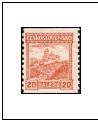
Château de Karlův Týn