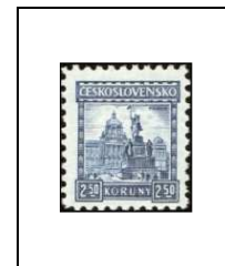
Statue de saint Wenceslas (Prague)