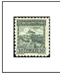
Château de Pernstýn