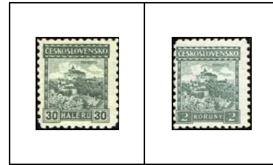
Château de Pernstyn