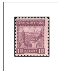
Monastère de Strahov et statue de saint Wenceslas