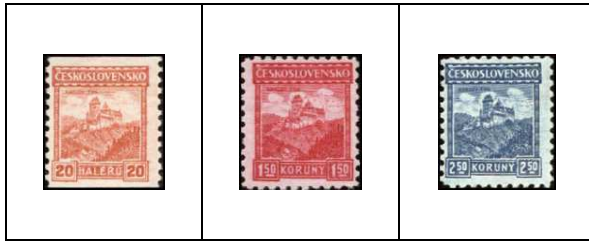
Château de Karluv Tyn