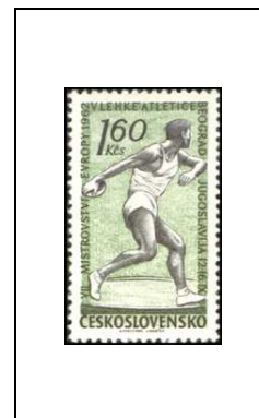
7 es championnats d'Europe d'athlétisme, à Belgrade