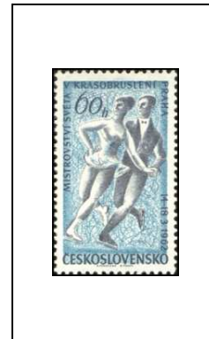
Championnats du monde de patinage artistique, à Prague