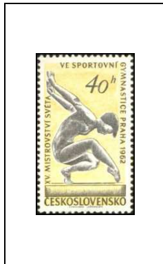
15 e tour cycliste de la Paix