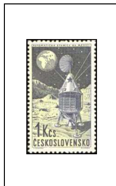
Station interplanétaire sur la Lune