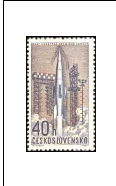
Fusée au départ