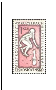
Championnats du monde de quilles, à Bratislava