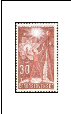
L'homme à la conquête de l'espace