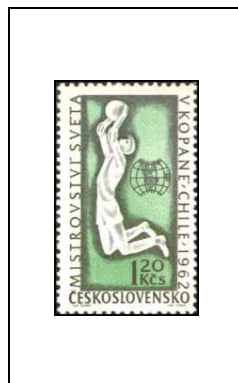
Coupe du monde de football, au Chili