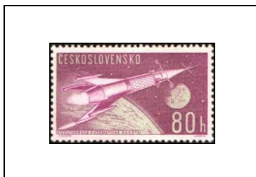
Fusée en vol