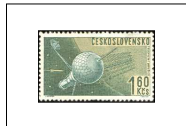
Relais de télévision dans le cosmos