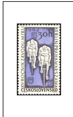
15 es championnats de gymnastique, à Prague