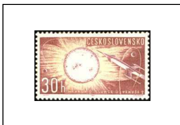
Soleil, Mercure et Vénus