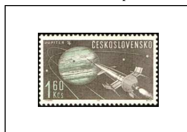
Fusée vers Jupiter