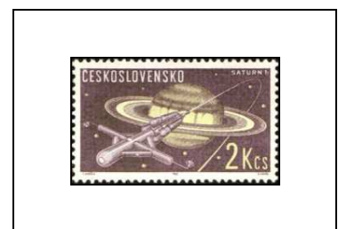
Fusée vers Saturne