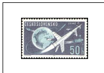
Lancement de satellites dans l'espace