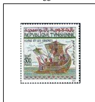
Mosaïque « Ulysse et les Sirènes » - Dougga – 3 e s.