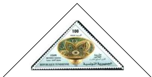
Coupe Methred en céramique de Qallaline - Tunis – 17 e s.