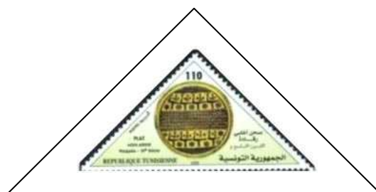
Plat en céramique aghlabide de Raqqada – 9 e s.